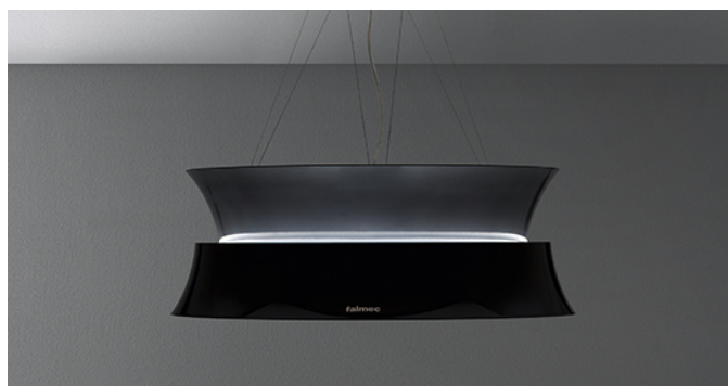
Immagine indicativa del prodotto Potrebbe non corrispondere alla versione selezionata